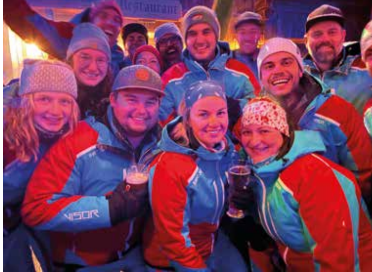
Einschulung der Skilehrer