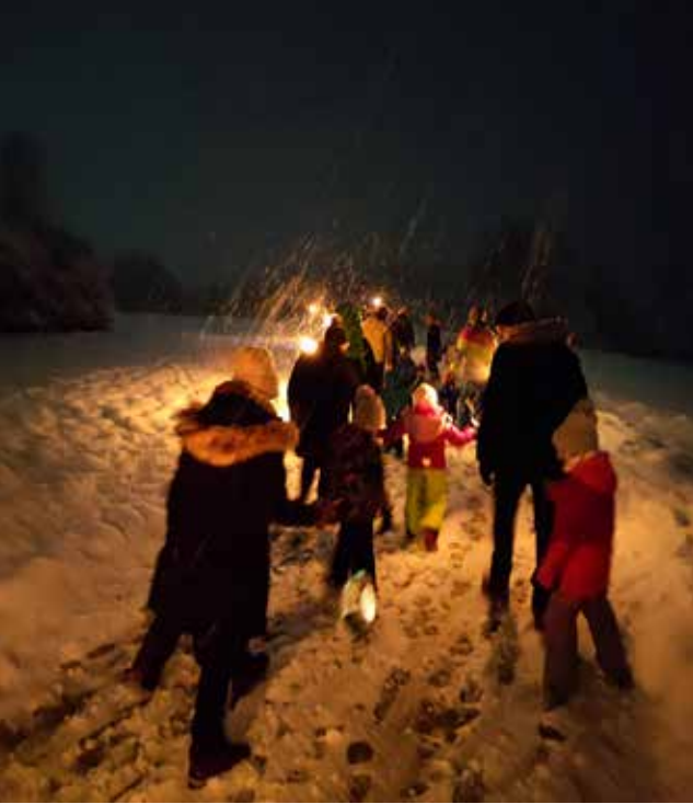
Kindernikolaus und Weihnachtsfeier