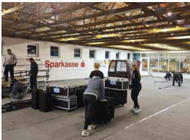
Aufbau Après-Ski Party